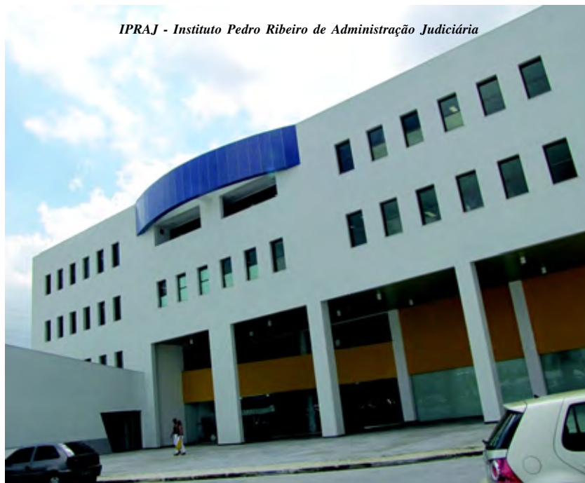
IPRAJ - Instituto Pedro Ribeiro de Administração Judiciária