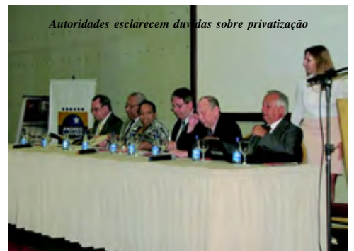
Autoridades esclarecem dúvidas sobre privatização