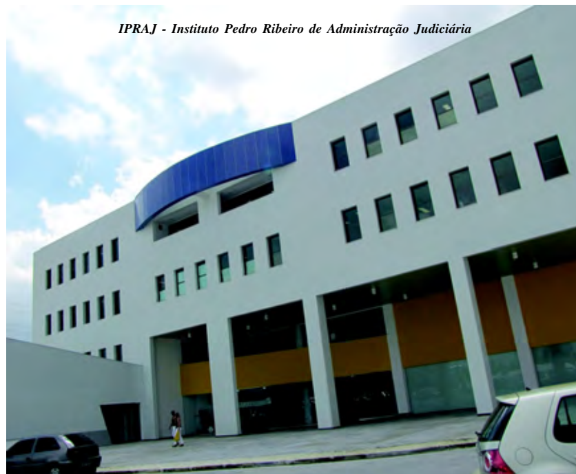
IPRAJ - Instituto Pedro Ribeiro de Administração Judiciária