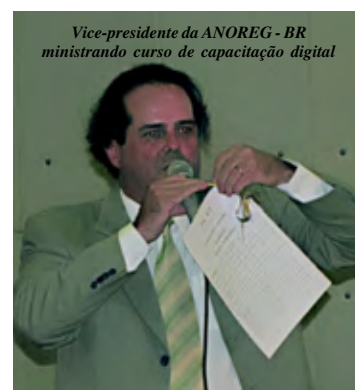
Vice-presidente da ANOREG - BR ministrando curso de capacitação digital

Temas abordados: A atuação institucional da Anoreg-Br e do Sinpojud; A atuação Política da atividade notarial e registral; O registro Civil de pessoas naturais e os novos modelos das certidões; O registro de títulos e documentos de pessoas jurídicas; O protesto de títulos e legislação vigente; Os registros públicos no contexto atual e o Programa Minha Casa, minha vida.