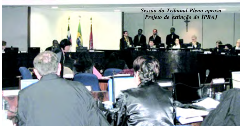
Sessão do Tribunal Pleno aprova Projeto de extinção do IPRAJ