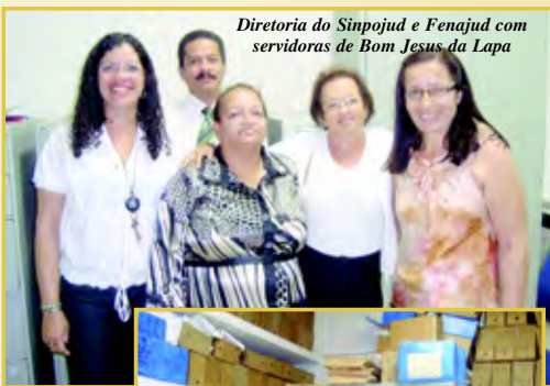
Diretoria do Sinpojud e Fenajud com servidoras de Bom Jesus da Lapa

Na ocasião, constataram diversos problemas estruturais, dentre eles os livros de registro, que se encontram em péssimas condições de armazenamento e manuseio. Além disso, os servidores do cartório ainda trabalham com máquina de datilografia.