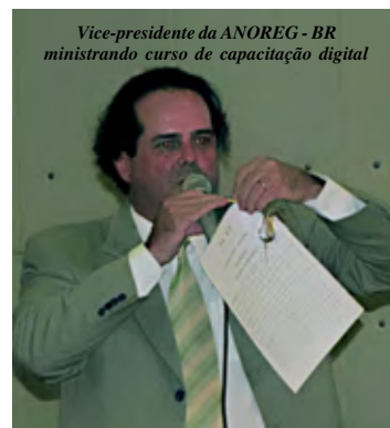
Vice-presidente da ANOREG - BR ministrando curso de capacitação digital

Temas abordados: A atuação institucional da Anoreg-Br e do Sinpojud; A atuação Política da atividade notarial e registral; O registro Civil de pessoas naturais e os novos modelos das certidões; O registro de títulos e documentos de pessoas jurídicas; O protesto de títulos e legislação vigente; Os registros públicos no contexto atual e o Programa Minha Casa, minha vida.