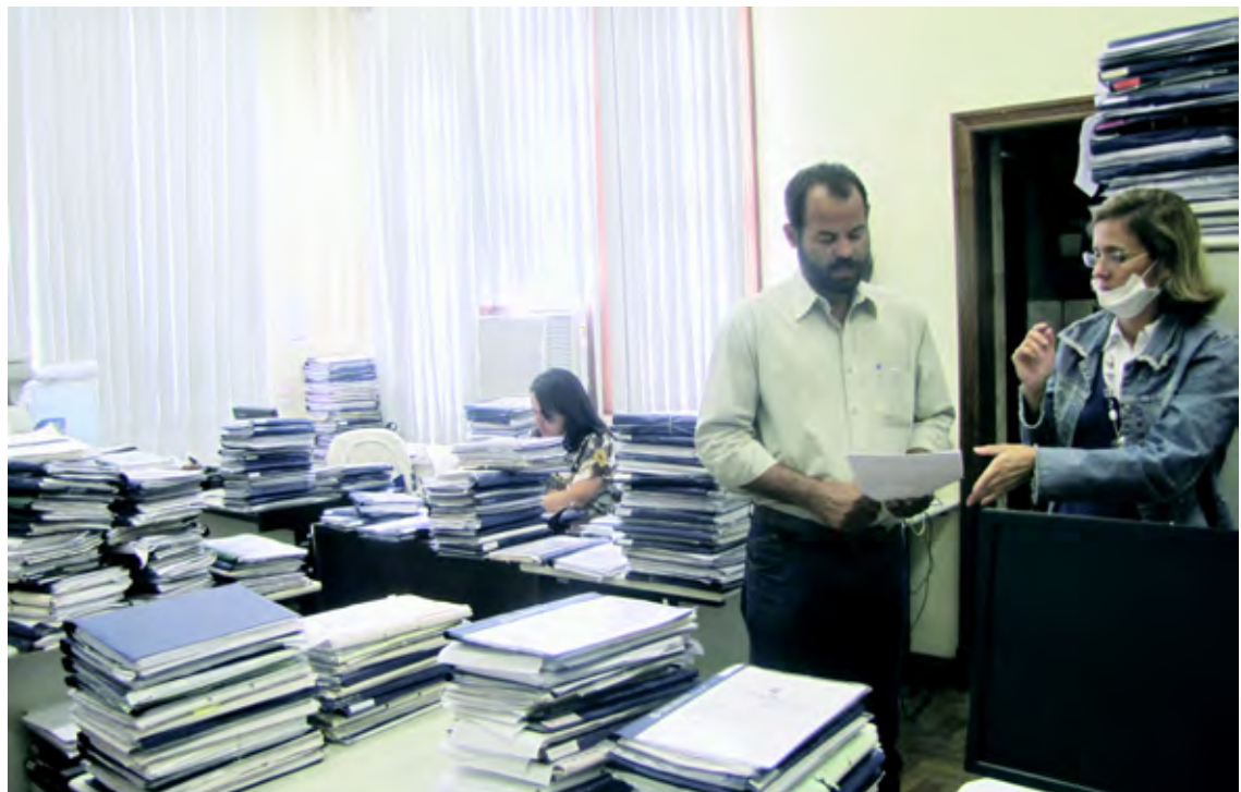
Acumulo de processos sobrecarregam servidores da Turma Recursal

De acordo com denúncia feita por uma funcionária da Turma Recursal, que preferiu não se identificar, as péssimas condições de trabalho que