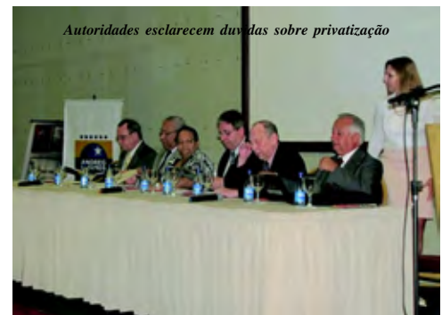
Autoridades esclarecem dúvidas sobre privatização