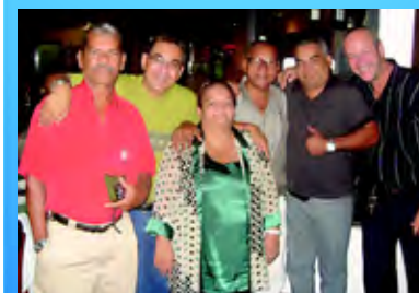
Presidente do Sinpojjud prestigia motoristas do Sinpojjud

O Sinpojjud proporcionou aos motoristas da entidade, um jantar comemorativo pelo dia do motorista, realizado no dia 25 de julho do corrente ano. Em clima de descontração, a Diretoria Executiva, juntamente com os funcionários e familiares aproveitaram um delicioso jantar, no Dique do Tororó, em Salvador.